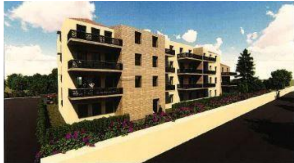
Projet du promoteur

On peut consulter ici le plan du projet .