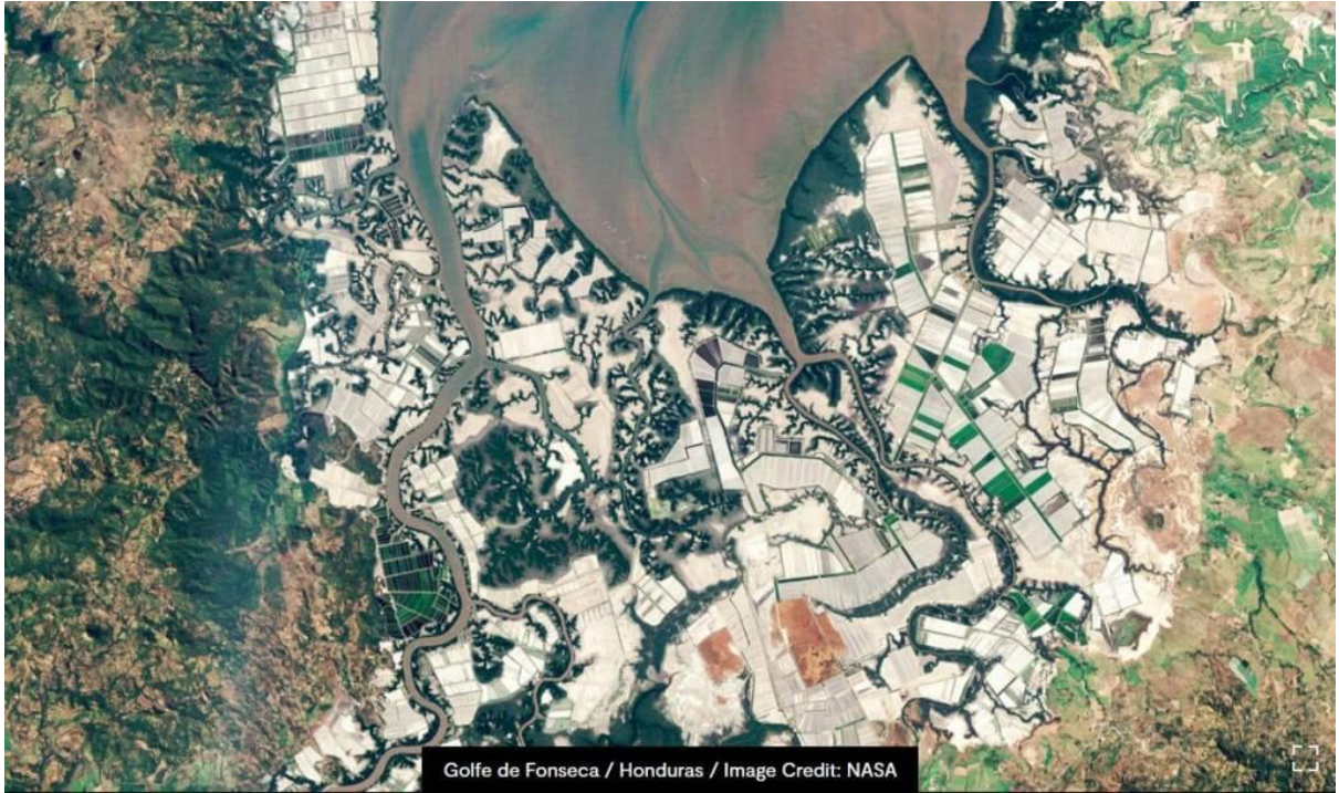
Golfo de Fonseca / Honduras